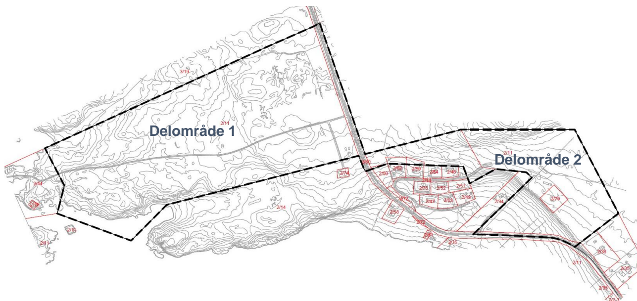
Figur 1: Kartutsnitt som viser planområdets avgrensning

I henhold til Plan- og bygningslovens § 12-8 varsles det om oppstart av detaljregulering for Blå Horisont Hjertvika på Gossen i Aukra kommune. Omtrentlig avgrensning av planområdet: